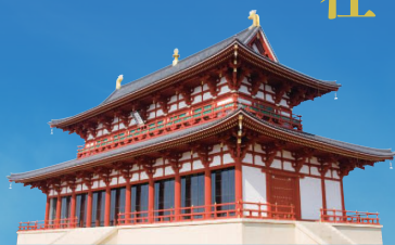
だいいちじだいごくでん —— 第一次大極殿 ——