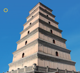
だいがんとう —— 大雁塔 ——