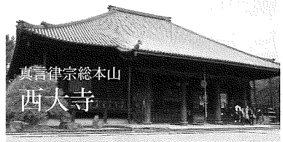
真言律宗総本山 西大寺

特別講演会の前に一緒に西大寺・平城宮跡を巡りませんか?歴史の舞台に足を運び空気を感じたら、講演会の面白さも倍増すること間違いなし!