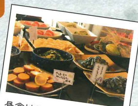
昼食は天平うまし館 tokijiku kitchenのビュッフェ♪

[集合] 西大寺(諸堂参拝・法話・大茶盛)…西大寺(奥の院)… 朱雀門ひろば天平うまし館(昼食)…朱雀門ひろば見学(みはらし館VR、いざない館) …平城宮いざない館(特別講演会「西の大寺から日本を救う!」)…[解散]