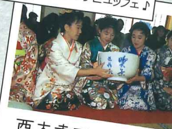
西大寺で 法話と大茶盛♪